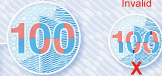
تصاویر مکمل (سیپترو) Offset See-through register