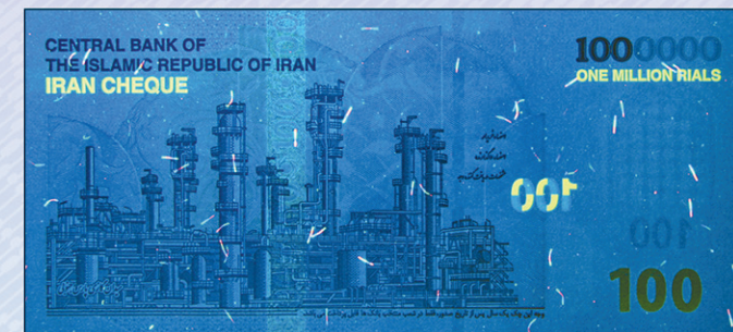
اندازه : ۱۵۶x۷۱ میلیمتر