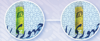
نخ امنیتی پنجره‌ای با رنگ متغیر همراه با ریزنوشته و نقشه ایران Windowed security color shift thread with microtext and Iran's map