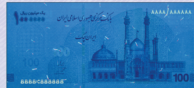
Size : 156 x 71 mm

Iran cheque paper does not reflect UV light. The invisible fluorescent fibers on the surface of paper are observed under UV light in four colors. Some parts of the design and serial numbers are printed by UV ink which is observable in green and yellowish gold colors under UV light.