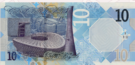
فئة (10) ريال: ستاد لوسيل وبرج الشعلة (أسيبر زون) وسدرة للطب والمدينة التعليمية (مؤسسة قطر).