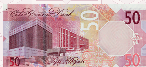
فئة (50) ريال: مبنى مصرف قطر المركزي ومبنى وزارة المالية