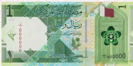
QR1: Traditional Dhow (Bateel) and the Oyster and Pearl Monument.

تضم تصميمات الوجه الخلفي للعملة سمات تعكس تراث دولة قطر وتاريخها الإسلامي وحضارتها وبيئتها النباتية والحيوانية والتطور التعليمي والرياضي والاقتصادي.