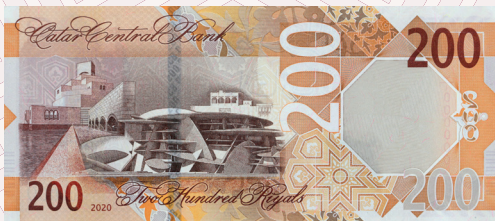
فئة (200) ريال: قصر الشيخ عبد الله بن جاسم آل ثاني ومتحف قطر الوطني ومتحف الفن الإسلامي