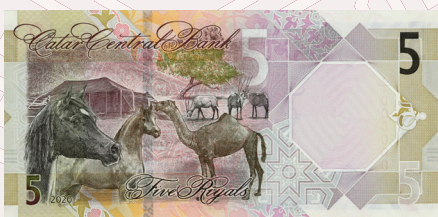
فئة (5) ريال: بادية قطر (الحصان العربي والجمال والمها وشجرة الغاف وبيت الشعر)