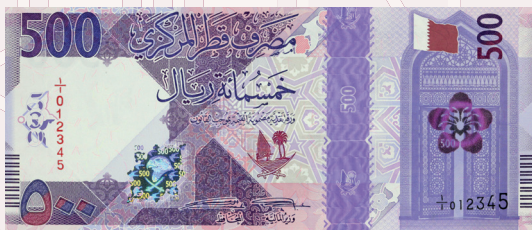
QR500: Ras Laffan LNG Refinery and LNG carrier ship.