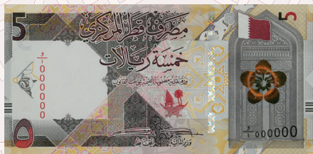
QR5: Traditional desert scene comprising fauna (Arab horses, Camel, Oryxes), flora (Al Ghaf) and 'hair tent' (buryut hajar).