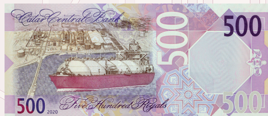
فئة (500) ريال: مصفاة الغاز المسال بمنطقة راس لفان الصناعية وناقلة الغاز المسال