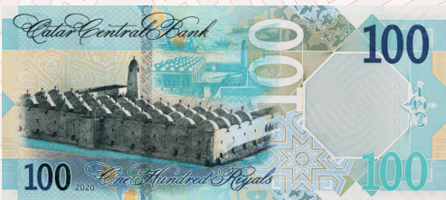
فئة (100) ريال: مسجد أبو القبيب