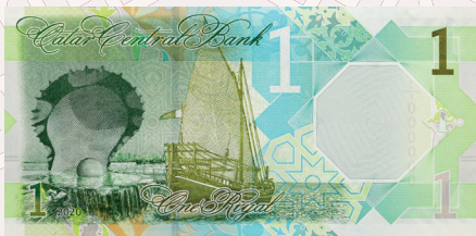
فئة (1) ريال: محمل البتيل ومجسم المحارة واللؤلؤة