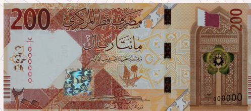
QR200: Palace of Sheikh Abdullah bin Jassim Al-Thani, Qatar National Museum and Museum of Islamic Art.