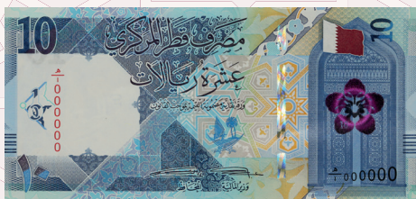
QR10: Lusail Stadium, Torch Tower (Aspire Zone), Sidra Medicine and Education City (Qatar Foundation).