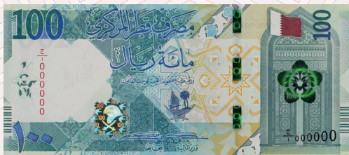
QR100: Abu Al Qubaib Mosque.